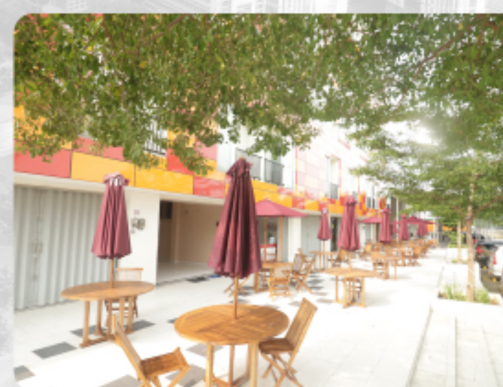
HANG OUT CORNER