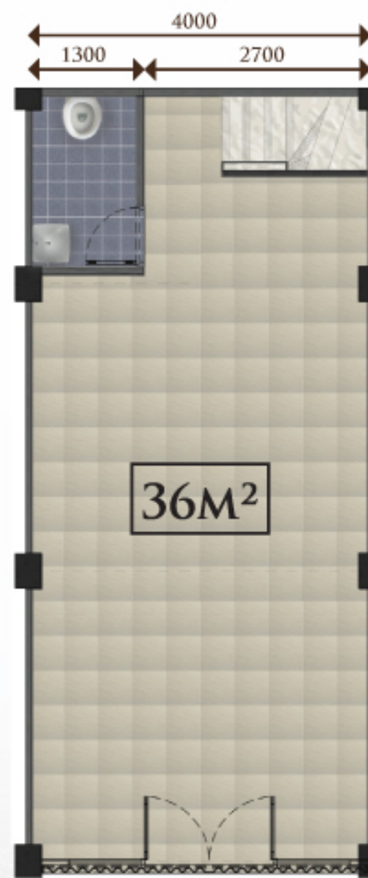
DENAH LANTAI 1